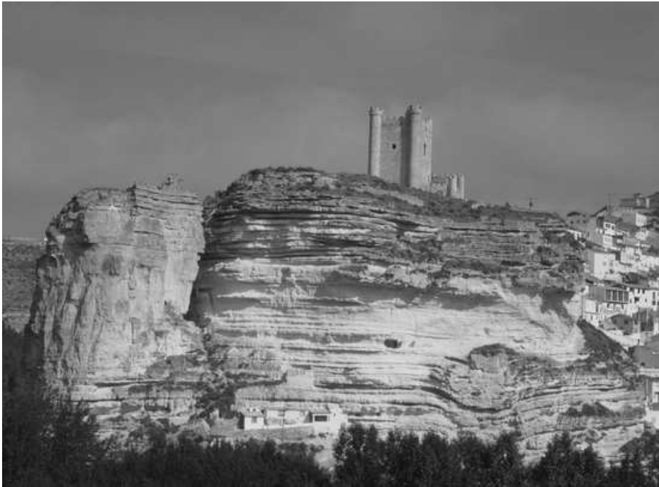
CASTILLO DE ALCALA DEL JUCAR

En 1.211 había comenzado con Alfonso VIII la ocupación del Valle del Júcar. La zona empezó a ser repoblada en 1.212 y probablemente recibió el Fuero de Cuenca y posteriormente el de Alarcón. La comarca de La Roda es más difícil saber el momento de la conquista, pero debió ser antes de 1.217. La conquista continúa, conquistándose Albacete en 1.241, Chinchilla en 1.242 y las zonas de Almansa y Hellín en 1.243.