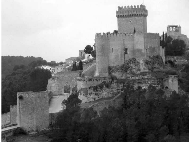
CASTILLO DE ALARCON

En 1.242 se termina la reconquista en el avance sobre el Reino de Murcia. Las primeras tareas fueron la cristianización y la repoblación. Las mezquitas fueron convertidas en iglesias. La población mudejar continuó viviendo en la zona que ocupaba; sin embargo, a partir de la grave sublevación de los mudéjares en 1.264, gran parte de estos emigraron, agravando la situación de un territorio ya de por sí escasamente poblado.