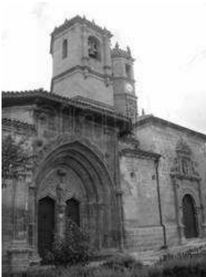
PUERTA DE LA IGLESIA DE LA TRINIDAD

Por último añadir que pese a su deseo de autonomía frente a otros poderes, Alcaraz ejerció una política opresiva sobre los lugares y aldeas que pertenecían a su término, sometiéndoles al pago de fuertes tributos.